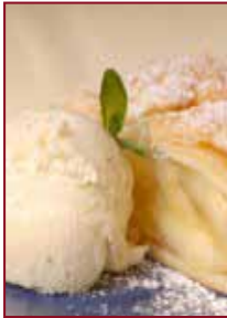
Schön was Leckerer hinterher. Man gönnt sich ja sonst nix...