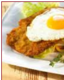
Geht doch nix über so ein schön gebratenes Wutzgeschnitzel...