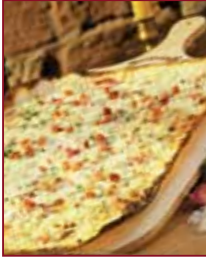
Flammkuchen frisch aus dem Ofen, ein Hochgenuss...