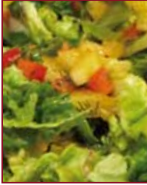
Frische Salate mit leckeren Dressings sind gesund und machen fit