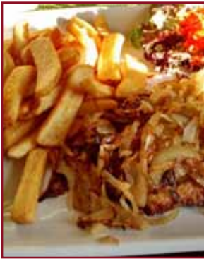
Geht doch nix über so ein schön gebratenes Wutzschnitzel mit Zwiebeln obedruff...