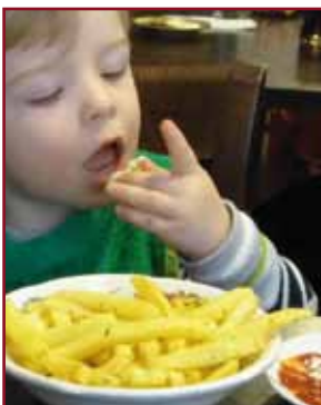
Wir freuen uns, daß es auch den kleinen Gästen gut schmeckt...