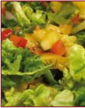
FrISChe Salate mit leckeren Dressings sind gesund und machen fit