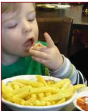
Wir freuen uns, daß es auch den kleinen Gästen gut schmeckt...