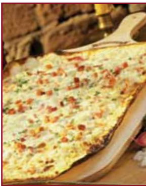
Flammkuchen frisch aus dem Ofen, ein Hochgenuss...